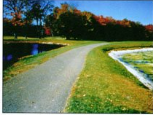
Solda: Havalandırılan gölet Sağda: Havalandırılmayan gölet

Otterbine'in Endüstriyel Havalandırıcıları su kalitesini yüksek tutmanın zor olduğu durumlar için dizayn edilmiştir. 1HP High Volume Serisi, her bir HP için 198.5m 3 /hr debi sağlarken suya 1.49 kg oksijen transferi yapar. Hafif tuzlu sularda da çalışabilen High Volume, Triton Aspirator ve Triton Mixer serisi havalandırıcılar 3 yıl, Air Flo sistemi ise 2 yıl garantilidir.