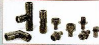
Easy Fit Bağlantı Elemanları