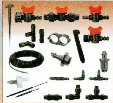
Diğer mikro sulama parçaları